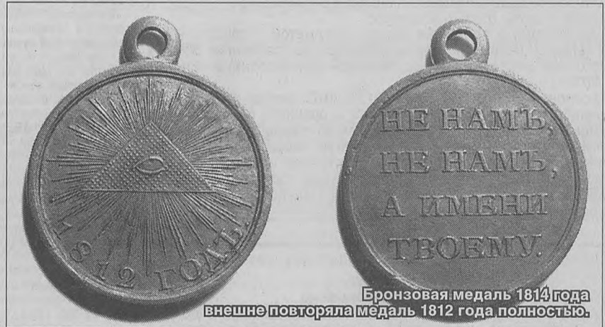
Бронзовая медаль 1814 года внешне повторяла медаль 1812 года полностью.