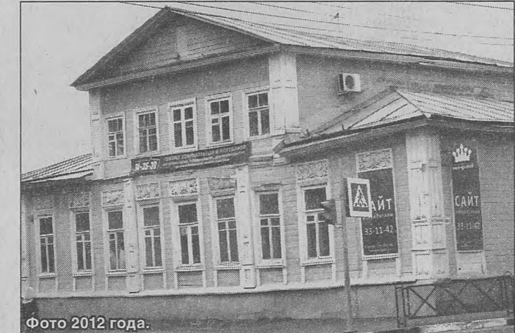
Фото 2012 года.

В 1919 году на снимке дом выглядел красивым парадным фасадом с колоннами, над которым балкон. На завершение здания треугольном был лепной вензель. Фасады декоративное убранство фасадов лепнина и украшавшие окна. Образец деревянного дома в стиле классицизма. Сам особняк был домом с украшением Дмитриевской площади и ул. Рождественской (современный Мукомольного переулка Большой Октябрьской). В 1970-е годы, при строительстве трамвайного кольца портик с балконом, в 1990-е годы дом «подчищен», упростили его фасад, убрали лепнину над окнами, заменили резные декоративные