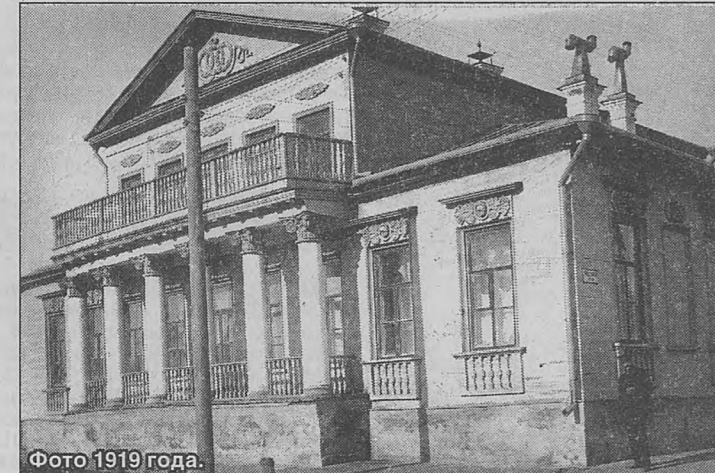
Фото 1919 года.

Мукомольного переулка Октябрьской улицы, напротив ансамбля Дмитрия Солунского, стоит деревянный дом с мезонином.