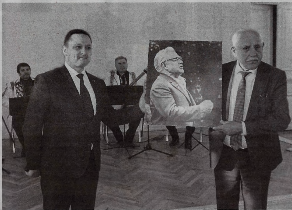
↓ Считавшийся утраченным фотопортрет Алексея Суркова на Некрасовском празднике поэзии теперь станет частью экспозиции Литературного музея в Рыбинске.

«Солдатский поэт» и «певец солдатских дум» – так называли Алексея Суркова современники. Сам он говорил про себя – «ровесник века». Он прошел с XX веком большую часть исторического пути, отразив его в своей лирике, а в чем-то сам став его отражением.