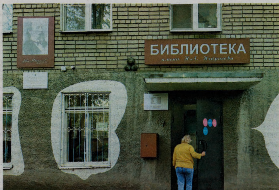
Некрасовка на Вольной.