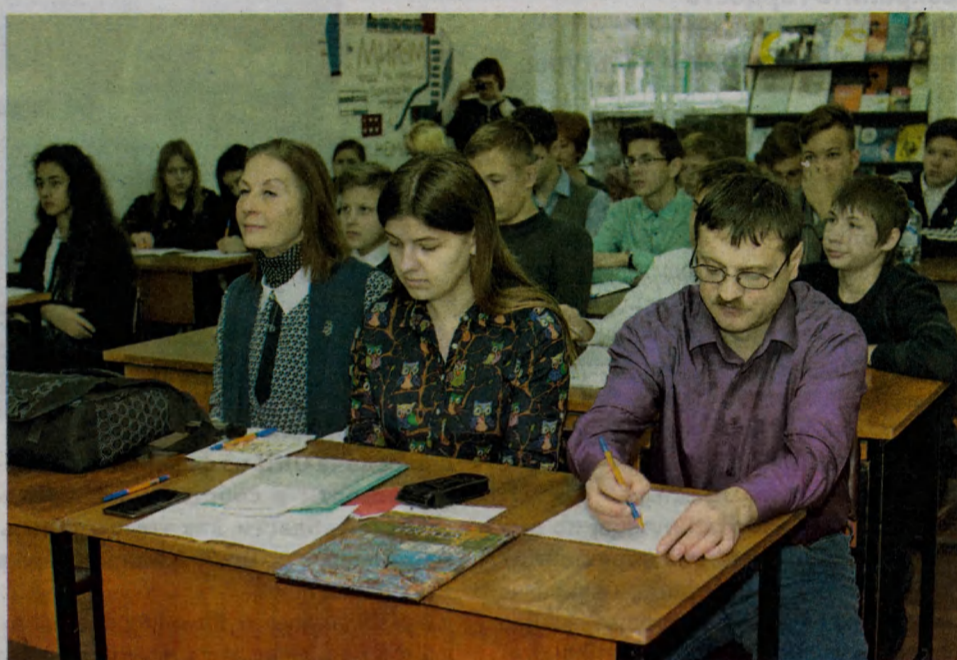
Филологические научные чтения.