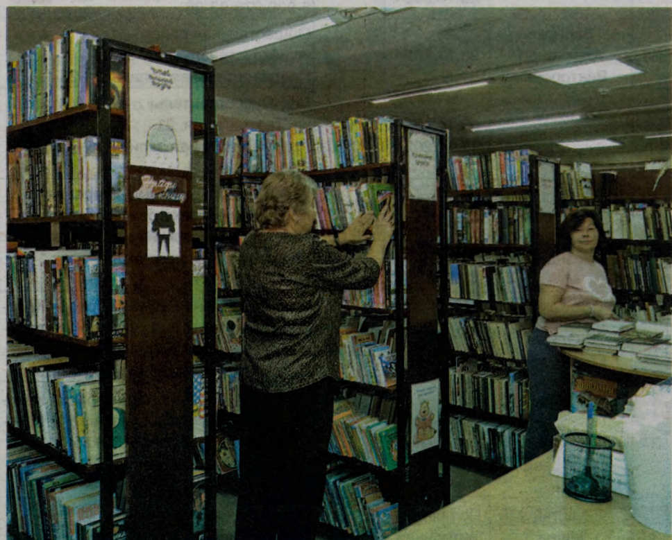
↓ В библиотеке.