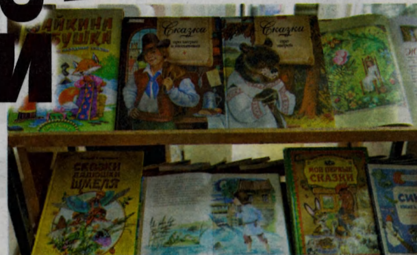
Здесь живут сказки (выставка книг).

Буккроссинги и выставки, презентации новых книг и встречи с писателями – современная библиотека – это не просто помещение, в котором хранятся книги, это место самореализации, интеллектуальных экспериментов, это настоящий храм мудрости. Сегодня, 30 октября, 125-летие отмечает одна из старейших библиотек Ярославля – юношеская библиотека имени Николая Алексеевича Некрасова.