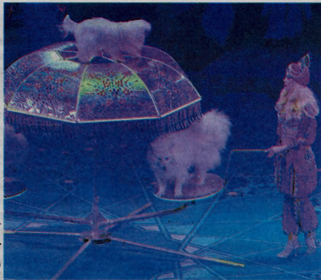
↓ Екатерина Запашная со своими питомцами.

«Песчаная сказка» – это уникальный театрализованный спектакль с единой сюжетной линией, внутри которой каждый номер становится неотъемлемым элементом шоу.