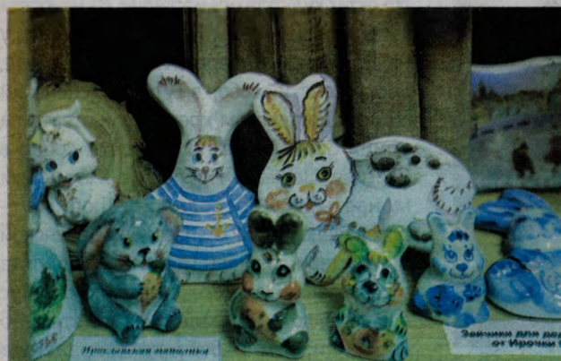
На полках книжных шкафов поселились зайцы.