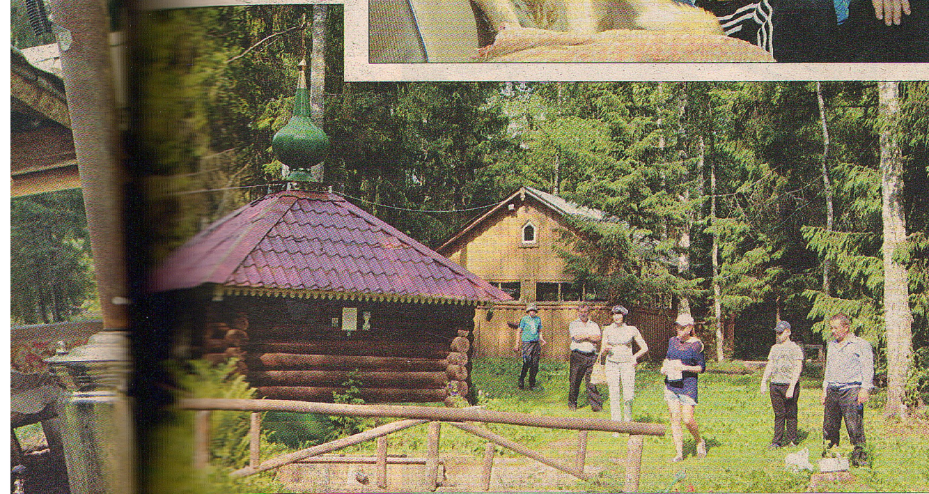
Ушица после службы в источнике, набрать целебной воды и окунуться в купели можно в любое время – двери здесь не запираются.