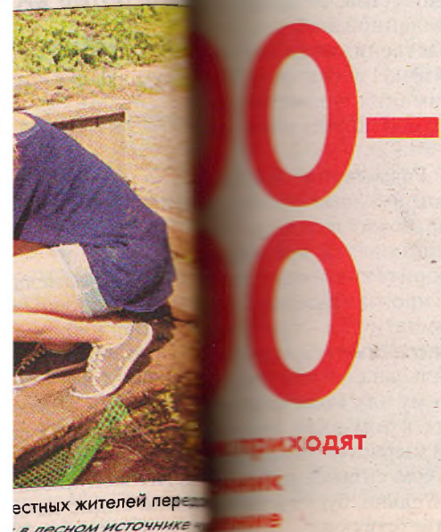
местных жителей пер... в лесном источнике...