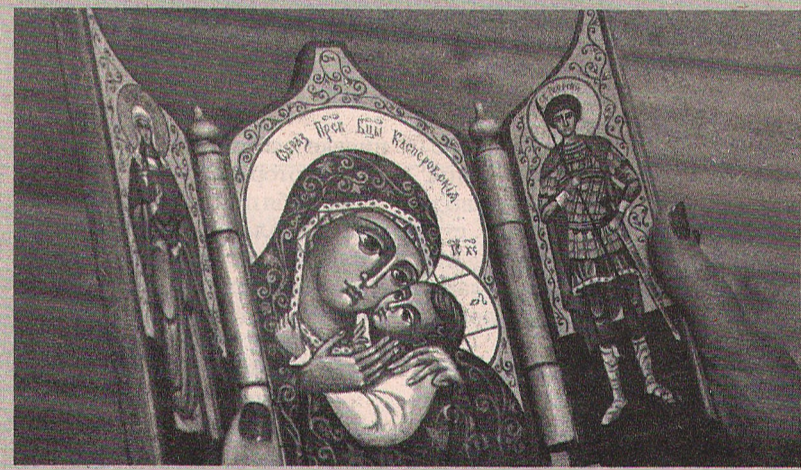
Икона-складень, сделанная и расписанная Топорковыми.