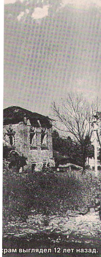
Храм выглядел 12 лет назад.