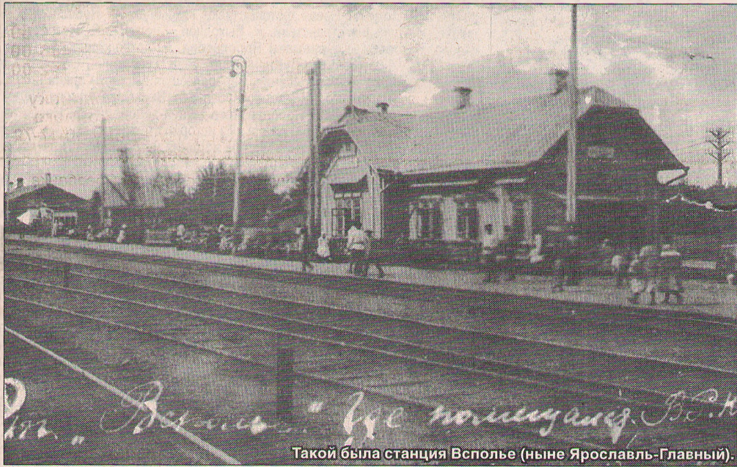
Такой была станция Всполье (ныне Ярославль-Главный).

Савва взялся за дело со... всей присущей его ха... рактеру страстью. Потом... вспоминали, что он мог обру... шиться на людей, как шквал... Он был похож на море – беспо-