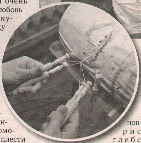
Тутаевские кружевницы возродили древний промысел. Здесь разработали обучающие модули по 6 – 8 часов для учениц 5 – 6-х классов. Кружевницами станут не все. Но в любой момент каждая из них может начать плести это уникальное кружево.

нов-Борисоглебске (нынешнем Тутаеве). Романовские кружева плели крестьянки и мещанки преимущественно в холодный сезон, когда не нужно было заниматься огородом. Говорят, самых умелых крепостных мастериц помещики к лавке цепями приковывали, чтобы те трудились, не сходя с места.