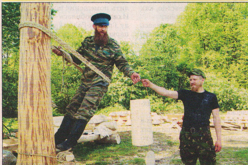
Бортники освоили высотный подъем намного раньше монтажников.

Особая ценность бортового меда заключается в его зрелости, наличии большого количества полезных микроэлементов, пыльцы и нектара, отсутствии вредных примесей.