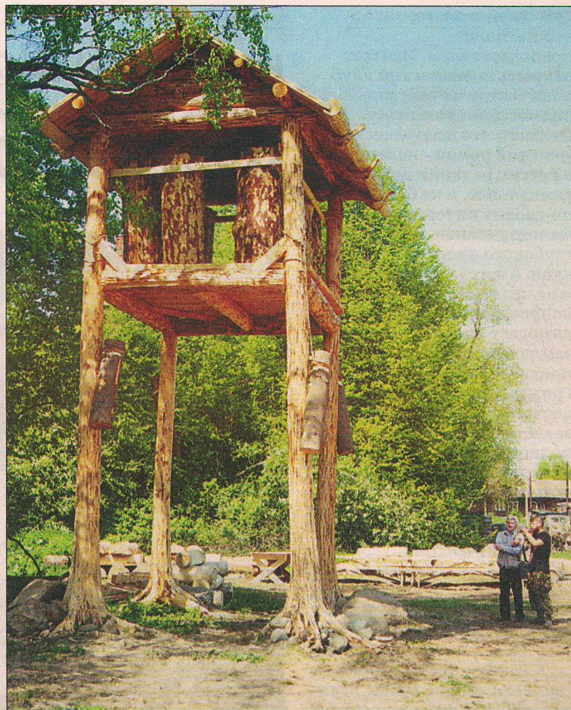
Высотная площадка с ульями-колодами – ноу-хау Олонцевых.