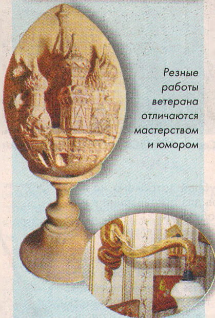
Резные работы ветерана отличаются мастерством и юмором