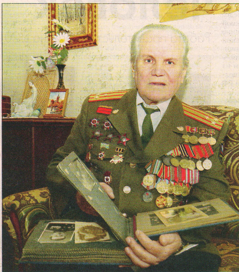
Жестокая война оставила следы от трех ранений и светлую память о погибших друзьях.