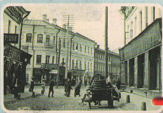
За минувшее столетие облик улицы Комсомольской (бывшей Большой Постоялой) практически не изменился.

Извечный вопрос «Куда крестьянину податься?» в прошлые века решался ярославцами легко и просто