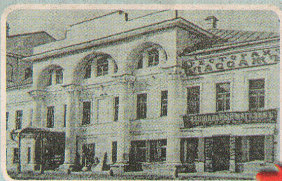
На Стрелецкой улице (ныне имени Ушинского) от бывшего трактирного величия остался лишь ресторанчик, приютившийся в торце бывшего «Пассажа».