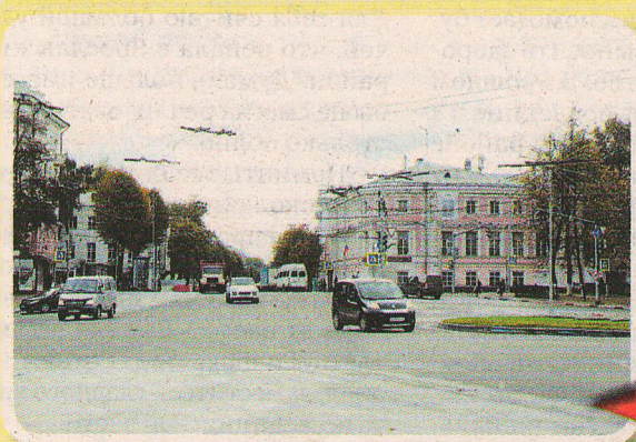
Дом офицеров на Семеновской (Красная площадь) сохранил и бравый вид, и свое предназначение.