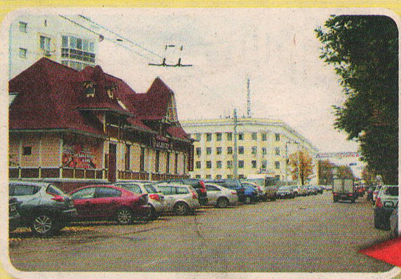
А вот на Республиканской (в прошлом Духовской) прежний ландшафт напоминает лишь одно реставрированное здание.