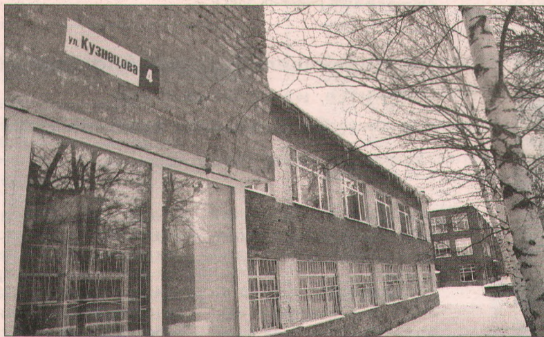
Улица Кузнецова в Ярославле, где находится автомеханический колледж.