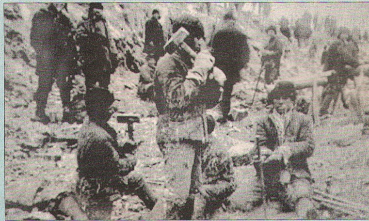
Заклученные разбирали учемские храмы на кирпичи для строительства.

С 1937-го похуже стало, потом еще хуже. В 1940-м так сделали: на 15 минут 3 раза опоздал на работу – год дают. В войну не было меня в Учме, но знаю, что окопы копали они».