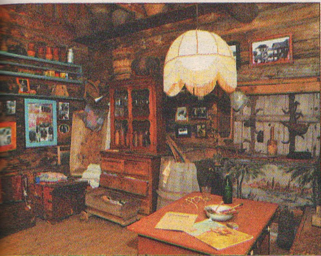
В музее крестьянского быта можно полистать страницы ветхих книг, включить патефон, посмотреть, что хранится в старом сундуке. А еще послушать голоса из прошлого – на аудиозаписях старожилов Учмы и окрестных деревень расскажут о том, как трудились в колхозе, а вечером собирались на завалинке.

Смирнов с одинаковым трепетом о кому не известных людях