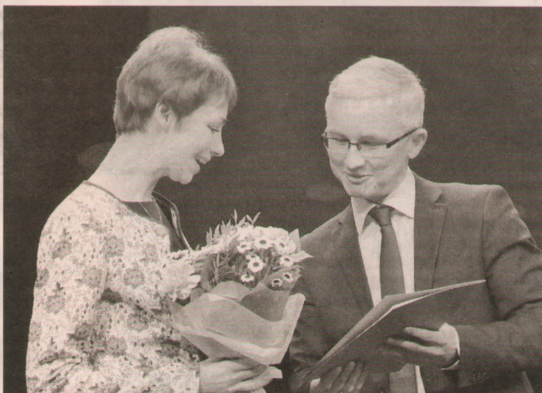
Юрий БОЙКО поздравляет авторов удачного книжного проекта.

Создатели книжной серии «Библиотека ярославской семьи» отмечены губернатором