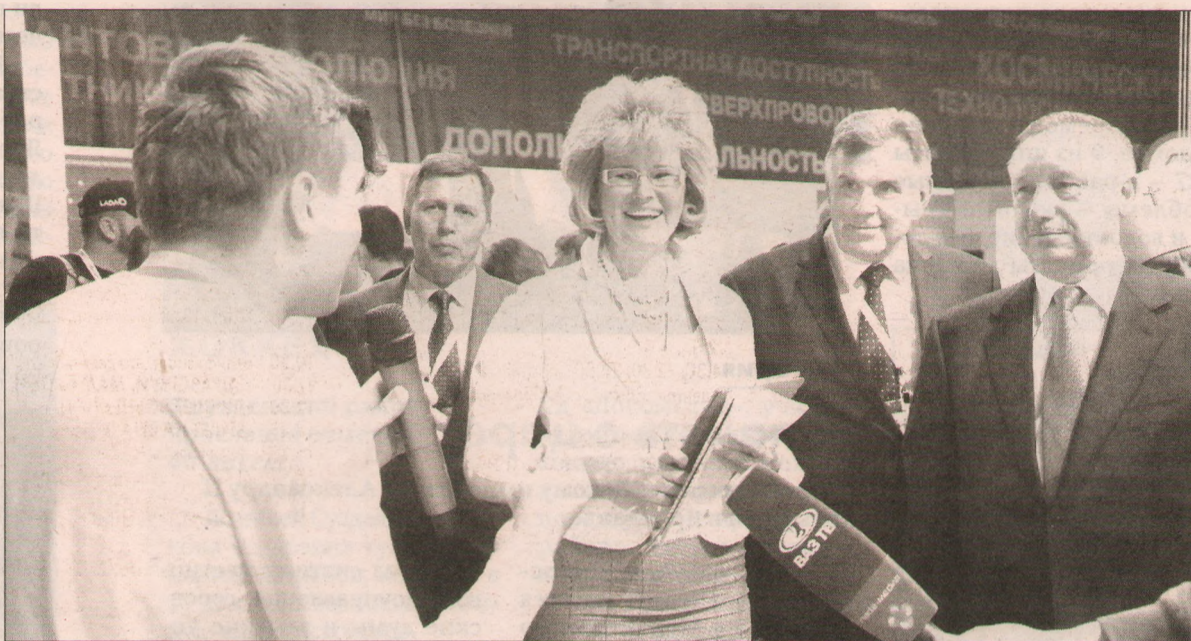
Юные ученые доступно объясняли устроителям самые сложные технические вещи.

Ведущие научные центры России приехали в Ярославль за молодыми кадрами