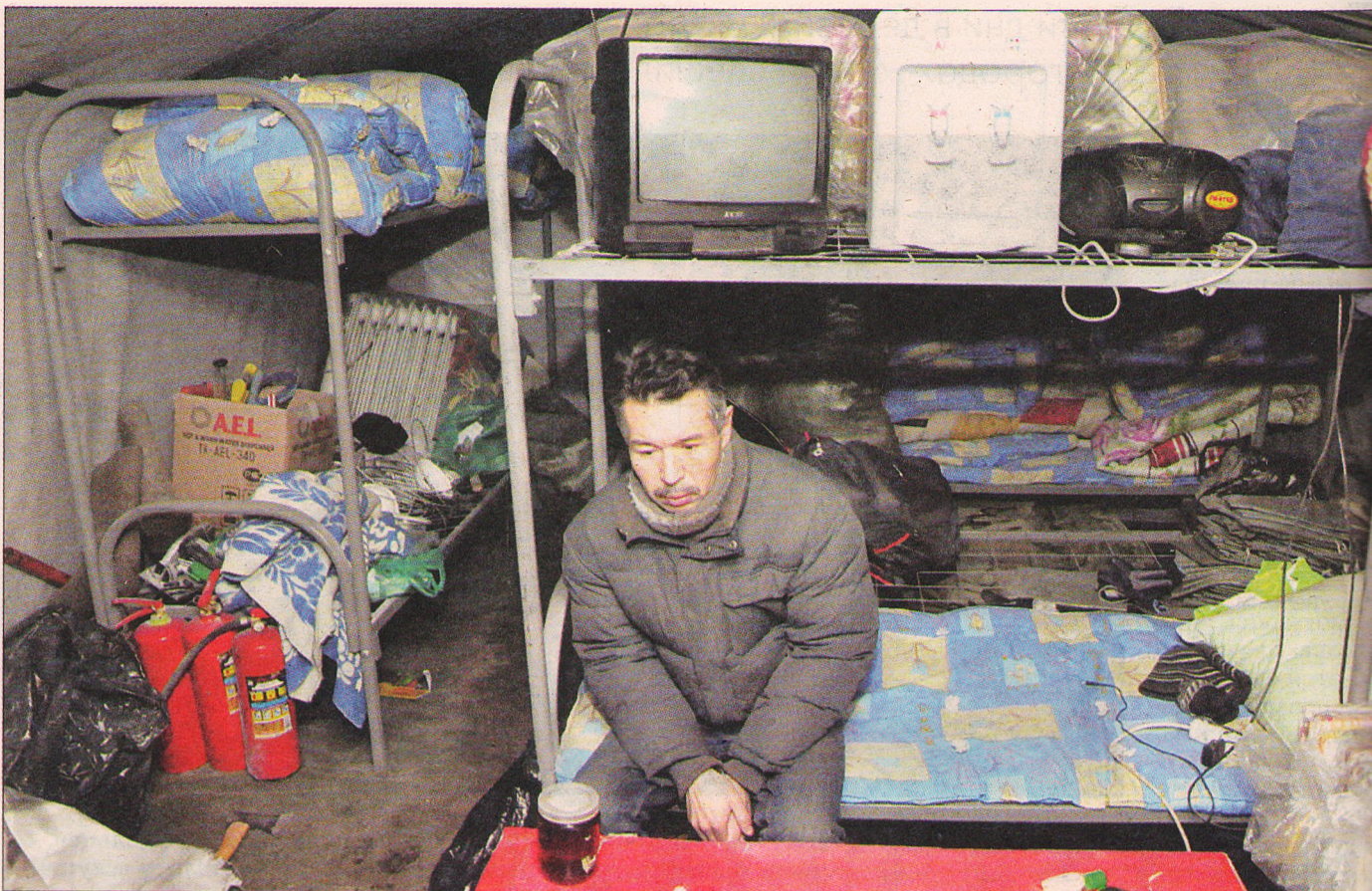
В палаточном городке предлагают ночлег и горячий ужин тем, у ко

В Ярославле открылся палаточный лагерь для бездомных