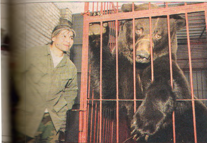
Медведи в цирке – обычно гвоздь программы.