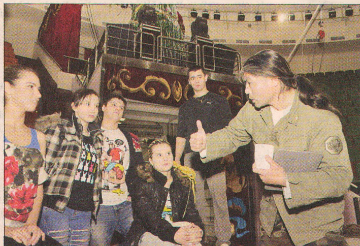
Новые идеи всегда можно обсудить прямо на арене.