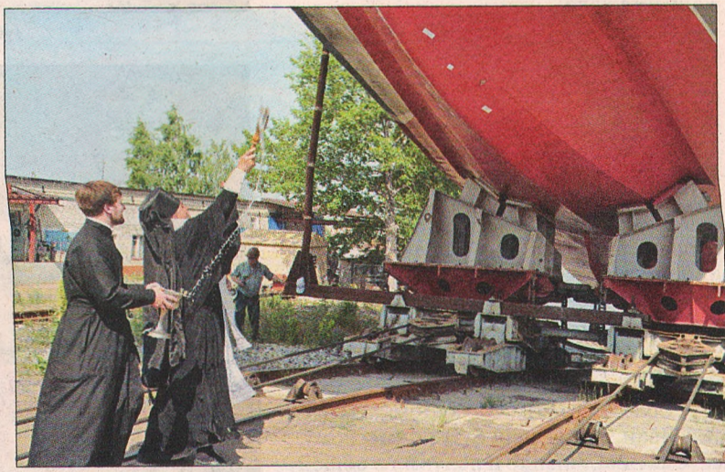
Десантному катеру «Мичман Лермонтов» предстоит военная служба во благо Отечества.

– Неужели в Бородинской битве участвовали восемь представителей вашего рода?