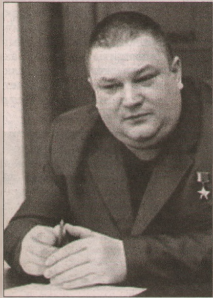
Алексей ЧАГИН, Герой Российской Федерации:

Движение сразу же получило название «новая пионерия», по аналогии с организацией, существовавшей в Советском Союзе. Мы решили узнать, как ярославцы отнеслись к появлению этого движения и что, на их взгляд, оно даст современным школьникам.