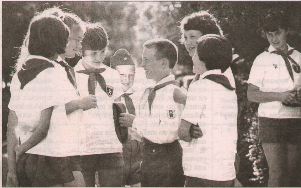
В пионерской дружине ребята учились дружить и вместе делать массу полезных дел.

Как ярославцы отреагировали на появление новой пионерии