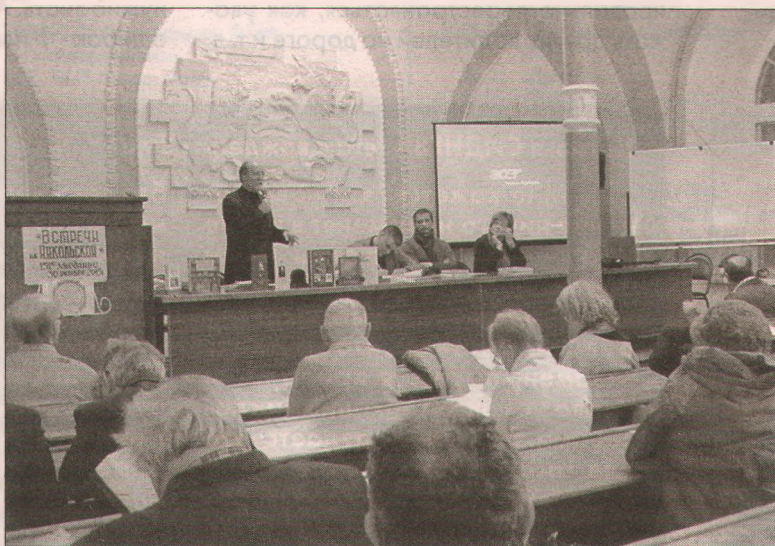
В Москве прошло 151-е заседание российских краеведов.

Титов был страстным собирателем книжно-рукописного наследия. Итоги этого увлечения поистине поразительные. Его ростовская коллекция к концу жизни насчитывала более пяти тысяч рукописных памятников XV – начала XX в. Коллекционер пожертвовал ее Императорской публичной библиотеке в Санкт-Петербурге.