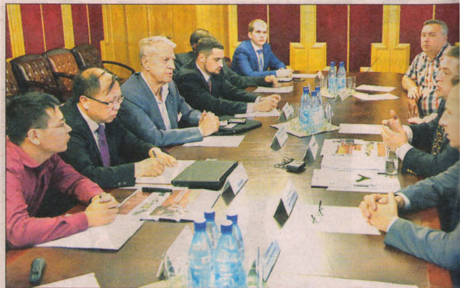
Китайская делегация на встрече в правительстве Ярославской области

– Среди несомненных преимуществ нашей облас-