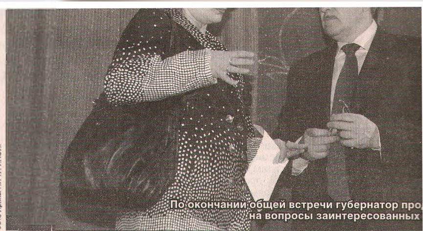
По окончании общей встречи губернатор про- ...на вопросы заинтересованных