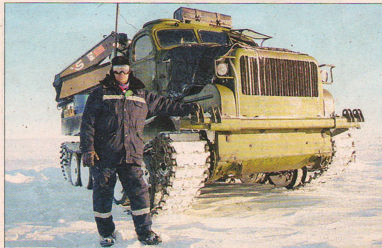
Для перевозки грузов полярники используют специальные вездеходы.