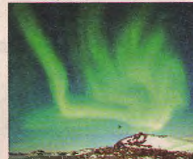
Природа и животный мир Антарктиды непривычны взгляду жителя средней полосы.