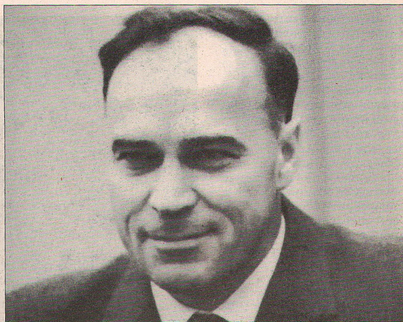
О нем говорили: жесткий руководитель, но очень доброжелательный человек.