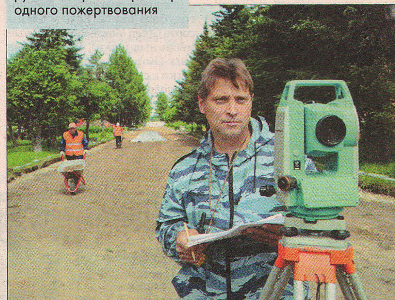
Аллею славы перед установкой памятника реконструировали.

200 рублей – средний размер одного пожертвования