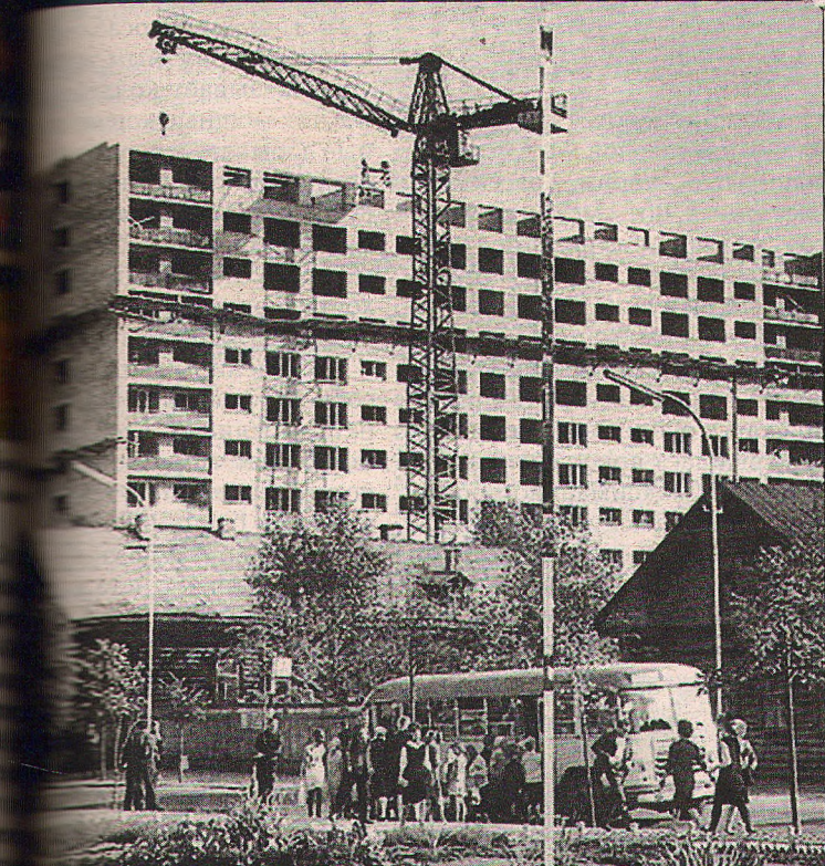
На месте частного сектора выросли высотные дома.