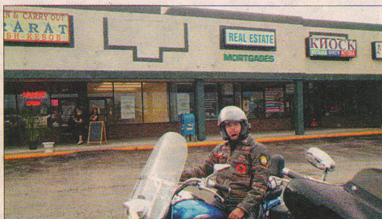
Провинция в Америке застроена низкоэтажными зданиями.