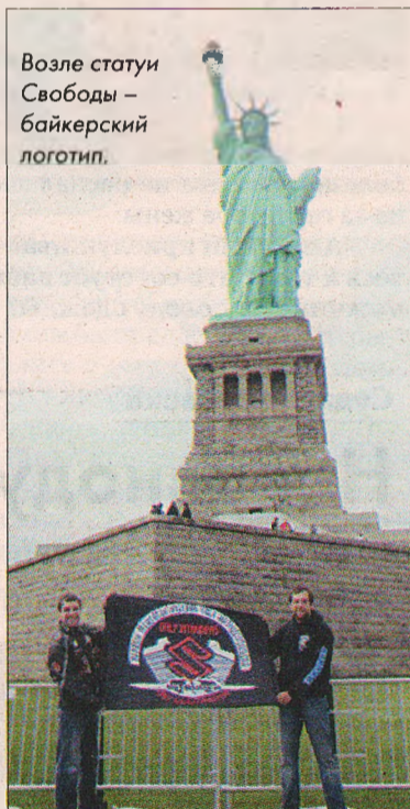
Возле статуи Свободы – байкерский логотип.