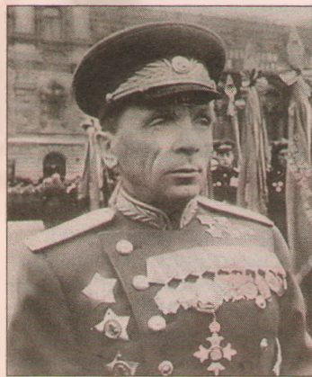
Бывший генеральный прокурор СССР в молодости воевал под командованием генерала Батова.

Памяти нашего земляка генерала армии Павла Батова (на фото), выдающегося полководца, одержавшего много побед в сражениях Великой Отечественной войны, была посвящена представитель-