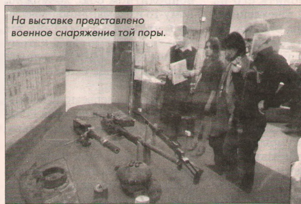
На выставке представлено военное снаряжение той поры.