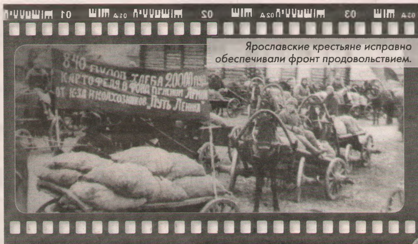
Ярославские крестьяне исправно обеспечивали фронт продовольствием.