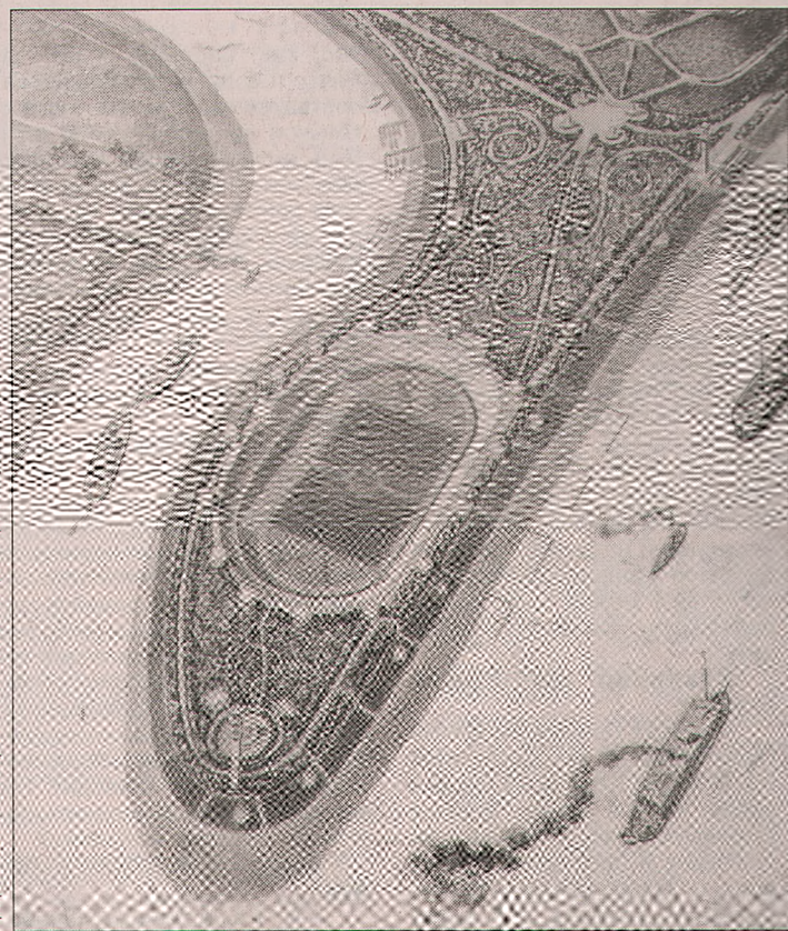
Титульный лист из проекта А. Никольского (из собрания музея «Стрелка»)

– Да, это я, – отвечает он. – А история такая. У нас в институте в 1970-е годы все почему-то переезжали из комнаты в комнату, и в какой-то момент я «поселился» в кабинете бывшего директора института