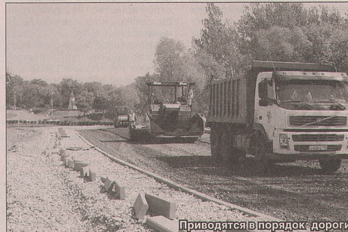
Приводятся в порядок дороги.

9 и 10 сентября в Ярославле пройдёт второй международный форум «Стандарты демократии и критерии эффективности». Фактически второй день форума станет началом открытия праздника. Планируется начать его в 17 часов с Советской площади. В этот же день вечером пройдёт официальное открытие памятника 1000-летию Ярославля на Стрелке. Организаторы очень надеются, что это произойдёт при участии первых лиц государства и иностранных гостей форума.