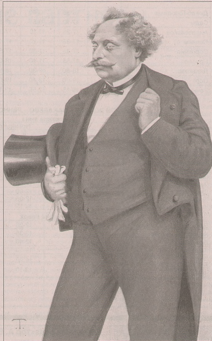
Портрет Александра Дюма из журнала «Vanity Fair» (1879 г.)

Мало того, упомянутым двум событиям, оказывается, предшествовало ещё одно. Читмый в здешних краях преподобный Арсений, живший в XIV веке, как гласит предание, тоже попал в похожую переделку. Только наоборот.