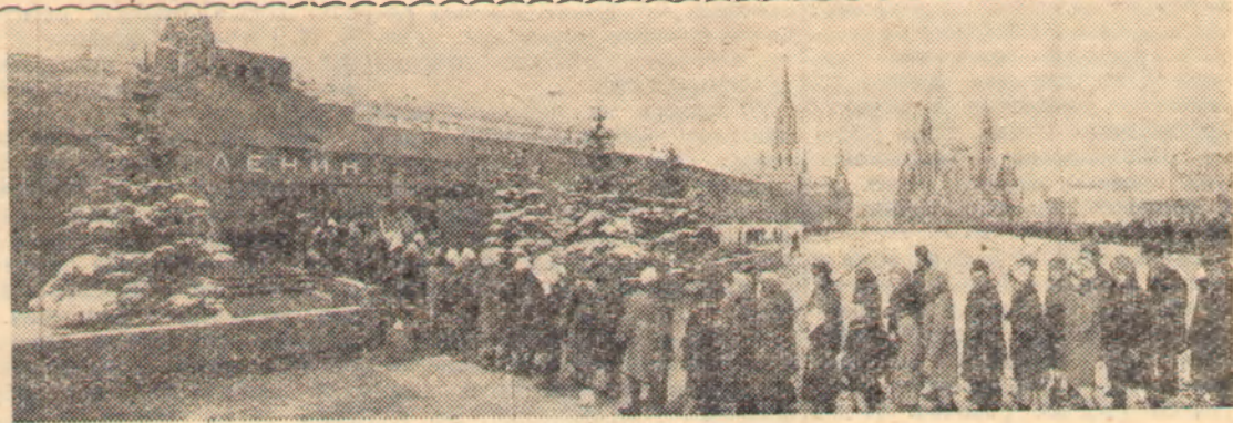
Москва, январь 1968 года. Нескончаемый живой поток движется по Красной площади... Ежедневно тысячи людей—москвичей, приезжих из разных районов нашей страны и зарубежных гостей приходит к Мавзолею В. И. Ленина, чтобы почтить память великого вождя, основателя первого в мире социалистического государства.