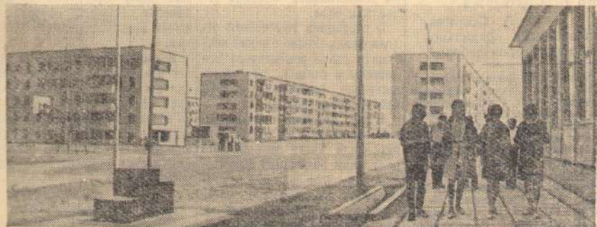
Ключи от 1.420 новых квартир вручили в этом году ташкентцам ленинградские строители. В скором времени будут сданы в эксплуатацию еще 1.378 квартир, детский сад на 280 мест и школа. За отличные показатели в работе многие ленинградцы награждены знаком «Строитель Ташкента».

Выходит журнал один раз в месяц. Стоимость номера 10 копеек, цена годовой подписки — 1 рубль 20 копеек.