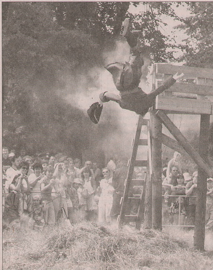
УРА, МЫ ЛОМИМ, ГНУТСЯ ШВЕДЫ

Кто-то из зрителей, со всех сторон плечом к плечу окруживших поле боя, надеявшийся увидеть сокрушительный разгром шведов уже в самом начале действия и в долгом ожидании слегка притомился, поджарившись под полуденным солншком, недовольно ворчал – дескать, чего ждём, вперёд в атаку и дело с концом.