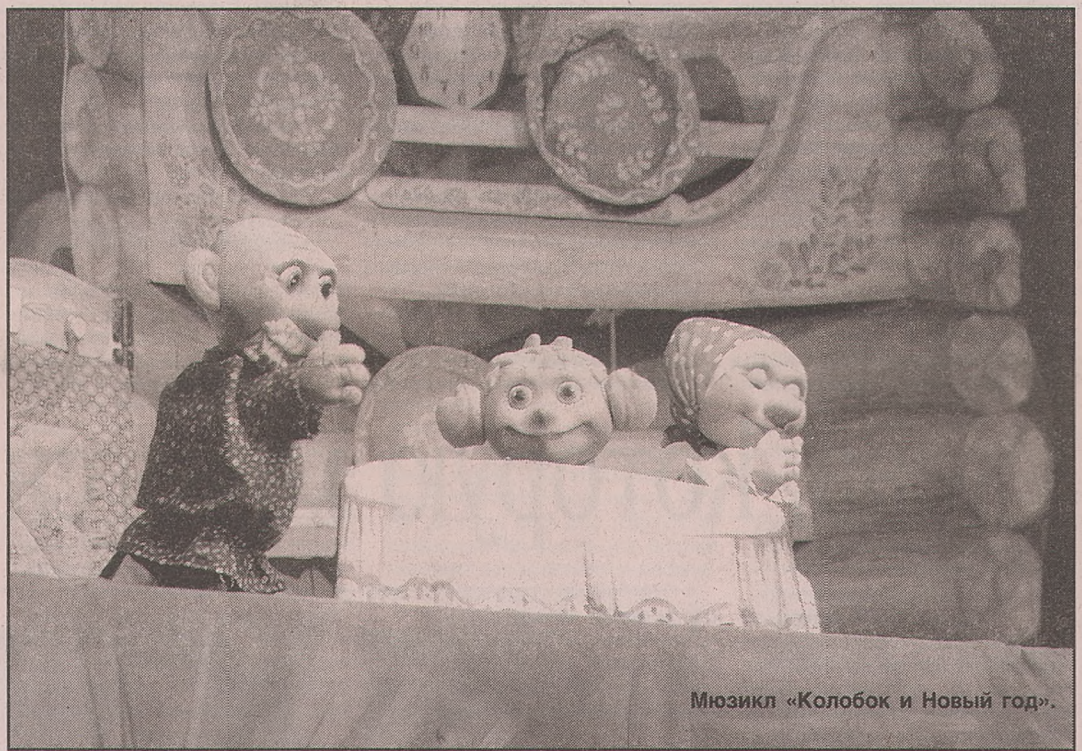
Мюзикл «Колобок и Новый год».