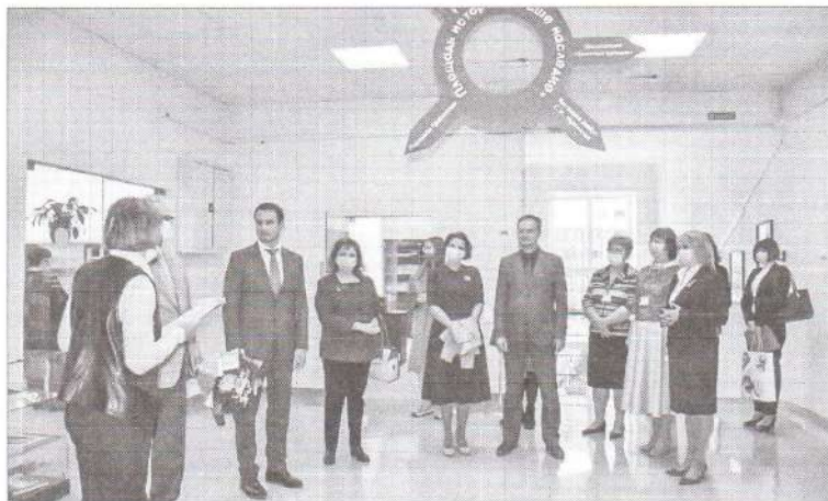
▲ На месте первого краеведческого музея теперь «Площадь истории». Следуя по одному из указателей, можно познакомиться с храмами района, старинными предметами быта, летописью местной фабрики или «полистать» страницы биографий известных земляков