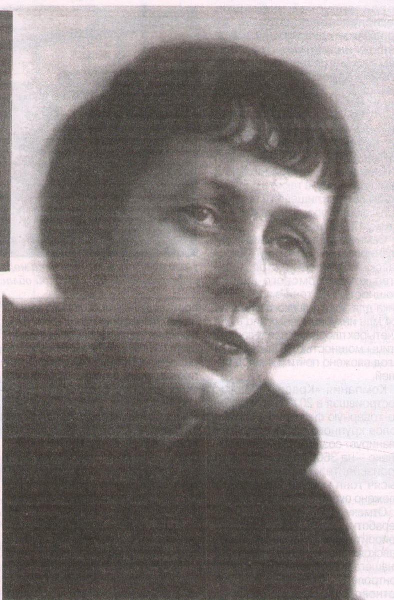
Мария Петровых — один из ярчайших поэтов XX века, уроженка Ярославской земли.

Исследования по формированию литературной среды нашего края позволили установить, например, более полный состав Ярославского Союза поэтов и его историю. Оказалось, что Союз поэтов — первое в Ярославском крае организованное литературное сообщество.