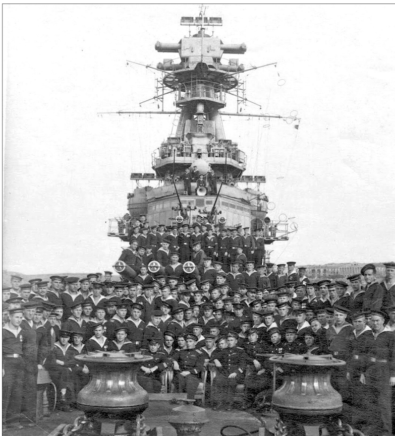
В память совместной службы. Севастополь. 1945 г.