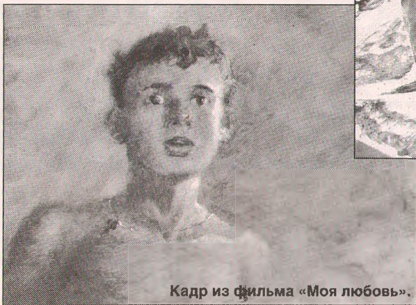
Кадр из фильма «Моя любовь».

чая оscarоносного «Старика», ставшего уже фирменным подарком для гостей Ярославля) их просто не найти.