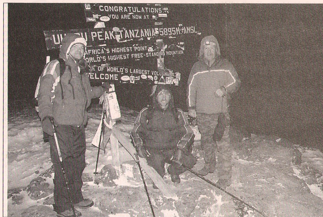
Альпинисты на вершине Килиманджаро.