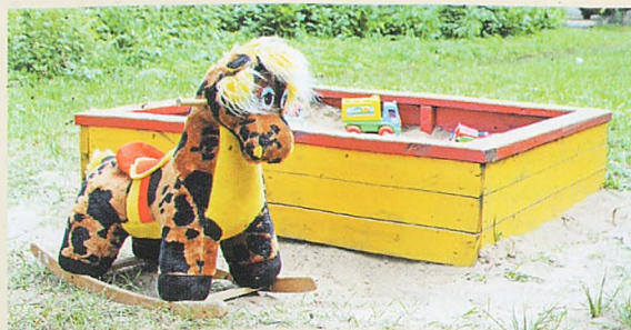
В ДЗЕРЖИНСКОМ РАЙОНЕ ПЯВЛЯЮТСЯ НОВЫЕ ДЕТСКИЕ ГОРОДКИ, НО ДЕРЕВЯННАЯ ПЕСОЧНИЦА – УЮТНЕЕ.