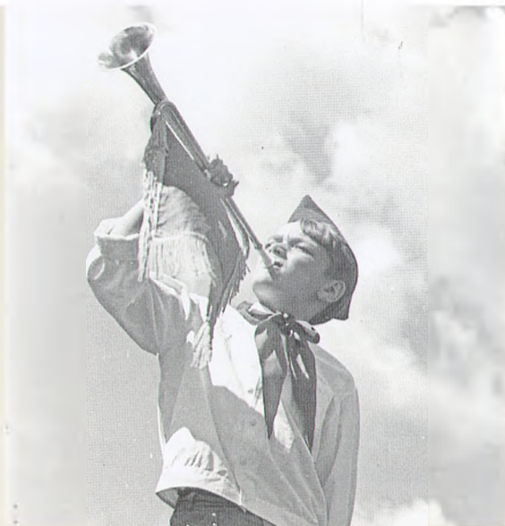
ПИОНЕРИЯ 1970-1980-Х ГОДОВ.

Общественно-полезный труд в школах давно отменили. Сельскохозяйственного труда тоже