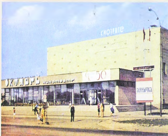
КИНОТЕАТР «ОКТОБРЬ» ДОЛГОЕ ВРЕМЯ БЫЛ ЛЮБИМЫМ МЕСТОМ ДЛЯ ПРОВЕДЕНИЯ ДОСУГА ЖИТЕЛЕЙ РАЙОНА.

Но вернемся еще раз в тот период, когда кино было доступным и близким для народа искусством, да еще и выполняло пропагандистскую роль. В 1980-е годы кинолектории для школьников и их родителей, кинотеатры выходного дня работали почти во всех школах Дзержинского района, иногда проходили кинопраздники, посвященные съездам КПСС.