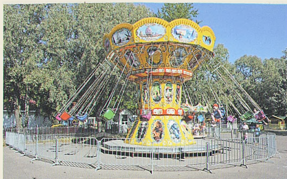
ДЕТСКИЙ ГОРОДОК С АТТРАКЦИОНАМИ В ПАРКЕ ПОБЕДЫ.