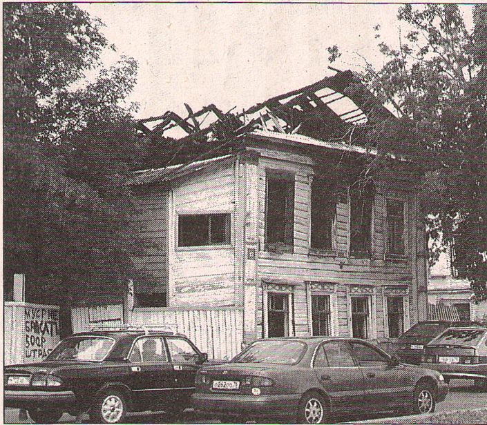
Трущоб в центре Казани становится все меньше, вместо них вырастают целые районы новостроек.

заялся неудачным для программы расселения ветхого жилья, потому что она финансировалась из республиканского бюджета и средств на нее не хватало. Поэтому и был создан под патронажем Минтимера Шаймиева внебюджетный государственный жилищный фонд: тогда законодательство позволяло субъектам Федерации вводить собственные сборы. Все предприятия республики перечисляли в фонд один процент от объема реализации продукции, а с каждой добытой в Татарстане тонны нефти туда переводилось 15 рублей (в год ее качают около 25 миллионов тонн).