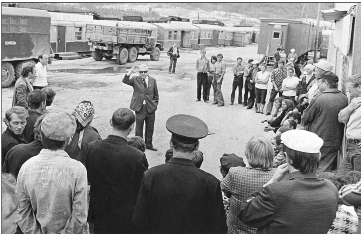
Поэт читает стихи путеукладчикам БАМа. Якутская АССР, Беркамит. 1977