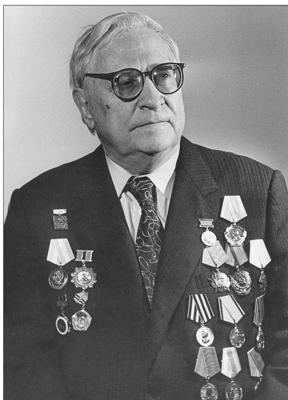
Л. И. Ошанин. 1995