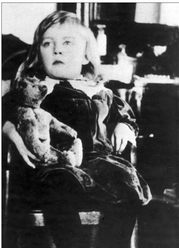
Лев Ошанин в детском возрасте. Ярославская губ., Рыбинск. 1915