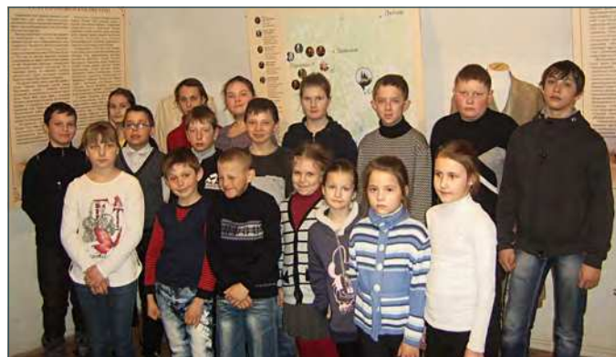
Учащиеся тороповской школы