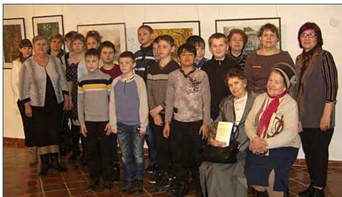
Гости из Середы