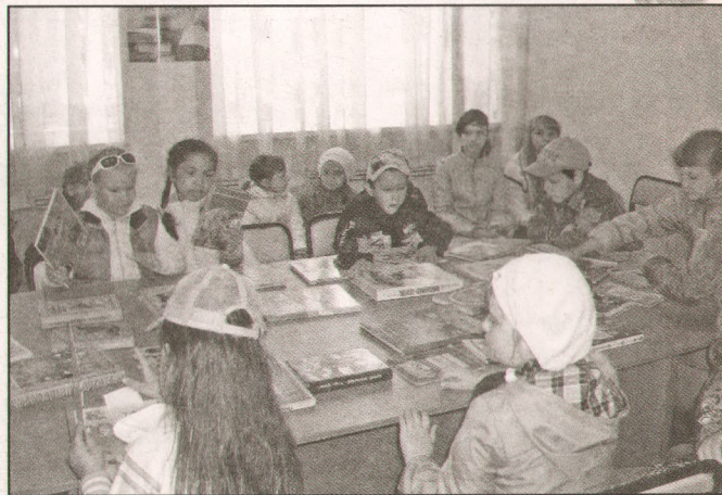
● Проект «Виртуальный книгочей» завершился совсем не виртуальным просмотром детской литературы в Библиотеке № 6 имени Л.Н. Третьякова

В.В. Бианки с просмотром мультфильмов «Хвосты», «Муравьишка-хвастунышка»; обзор книг с выставкой; викторина по произведениям писателя. Пользователи библиотеки стали свидетелями виртуального книгочая «Книга: маленькое окно в большой мир», который был необычен тем, что любимые издания своей семьи представляли сами читатели, взрослые и дети.