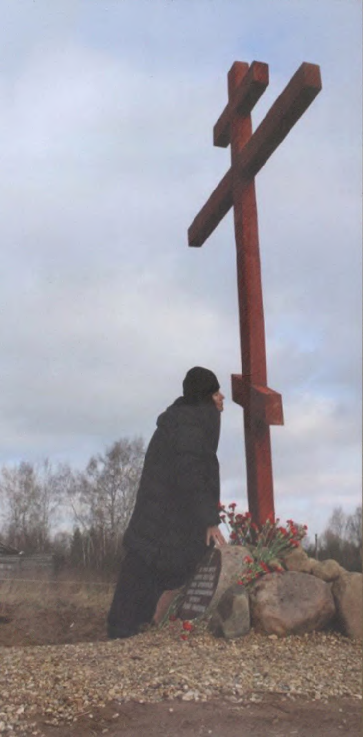
памятный крест на месте убийства священномученика Николая Любомудрова