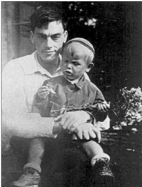
Арсений Тарковский с сыном Андреем. Середина 1930-х