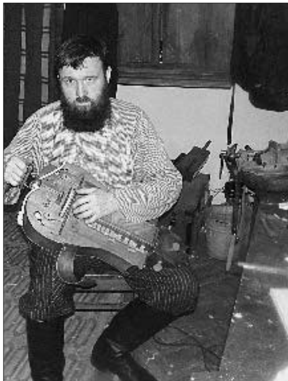
В мастерской народных музыкальных инструментов. Мышкин. Январь 2012-го