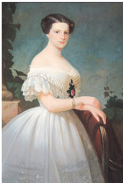
Баронесса Амалия Крюденер. Портрет работы А. Цебенса, 1865 г.

Ярославский поэт-демократ Леонид Трефолев.