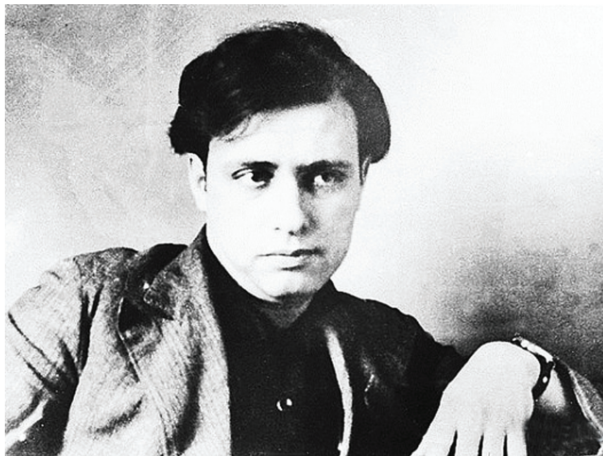
Уроженец Рыбинска, поэт-песенник Лев Ошанин.