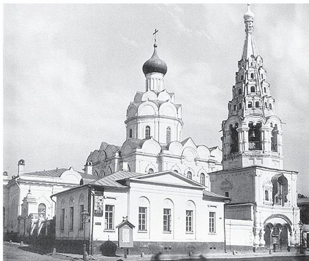
Церковь Николая Явленного на Арбате.