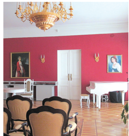
Красная гостиная угличского кремля.

Углич – незаурядная история этого древнего уголка русской земли, прекрасное природное окружение и выдающиеся творения зодчества