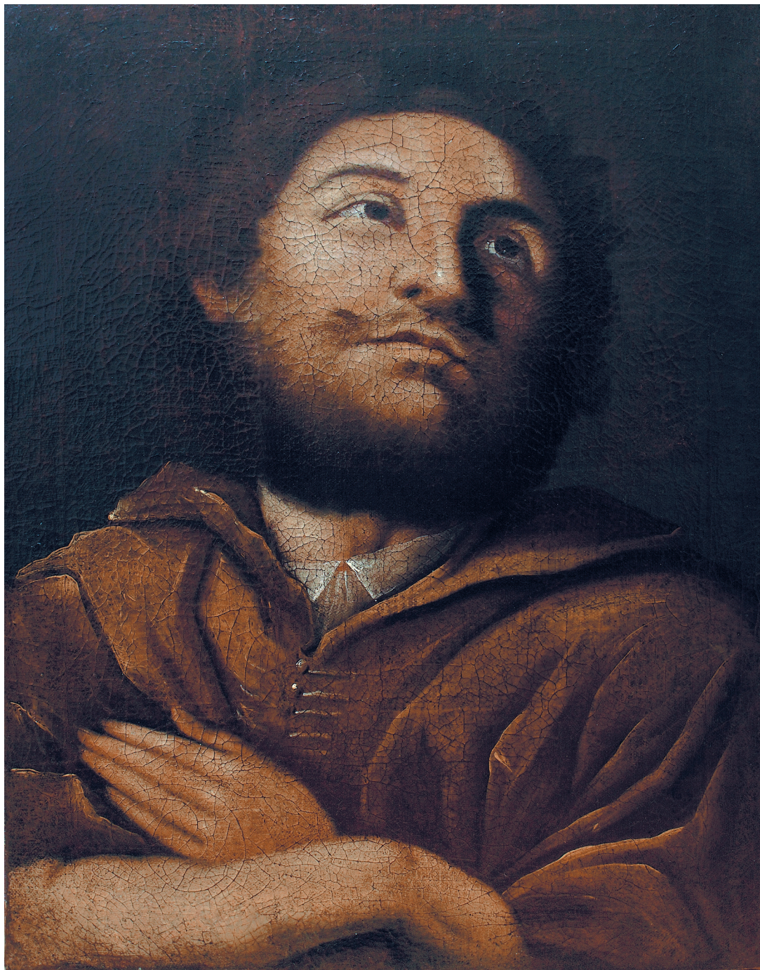
Неизвестный художник. Портрет неизвестного (Бантышева?). XIX в.